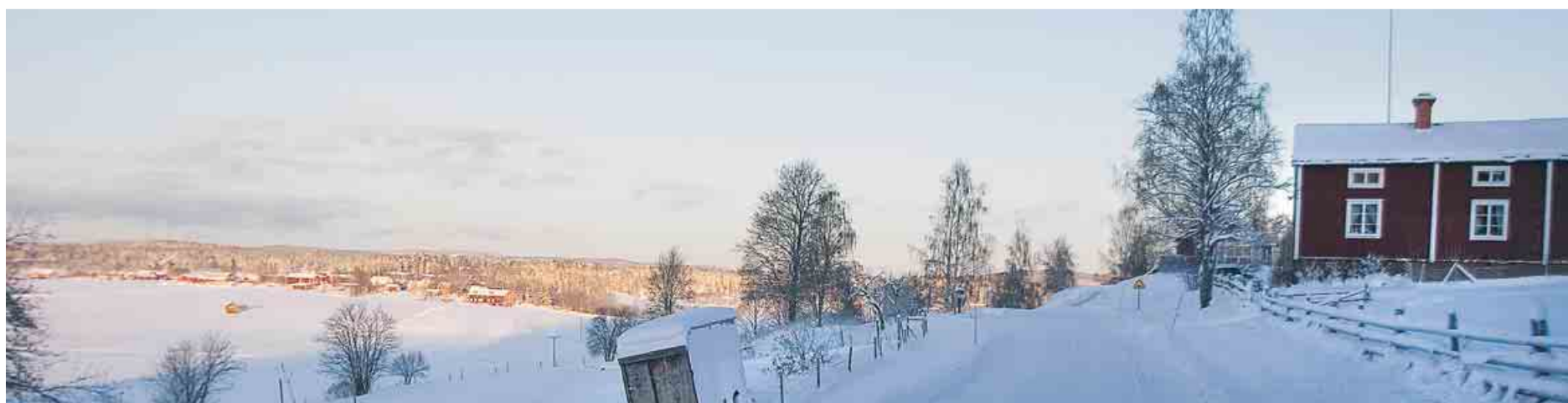
Lia heter en by i Hög. Den ligger i en lid som är en sluttning.